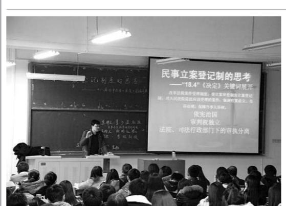
本报讯 12月4日晚,由民商事法律研究中心、民商法学院主办的题为“民事立案登记制度的思考”

先回顾了以往司法职业结构的分布情况,指出了法官、法官助理和行政人员“三三分”所存在的问题,他认为法官占30%,司法助理占50%,行政人员占20%这样的结构比较合理,应当让大部分人员投入到司法辅助工作中去,避免产生以往各三分之一结构下司法效率不高,浪费司法资源的问题。同时他强调高素质的司法队伍,是实现司法公正的人员保障,建立符合职业特点的司法人员管理制度,是建设高素质司法队伍的制度保障。 其次,肖教授强调司法职业群体应该走向精英化的进程,注重法律思维的训练,面对疑难案件应该