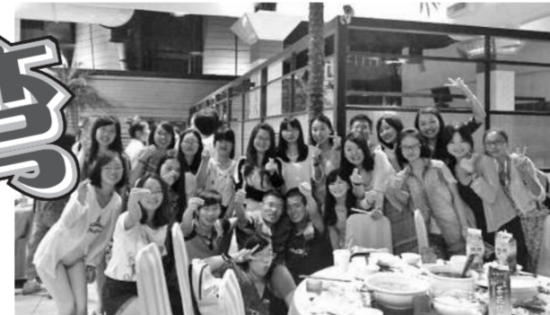
暑期我有幸前往台湾东吴大学参加了为期一个月的研学习。台湾带给我的暖暖的回忆充斥在我的心间,每一份,都是那