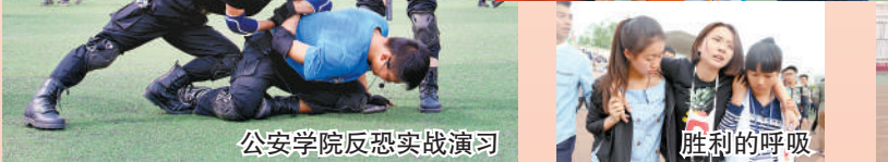
公安学院反恐实战演习