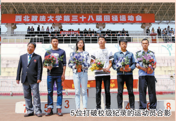
5位打破校级纪录的运动员合影