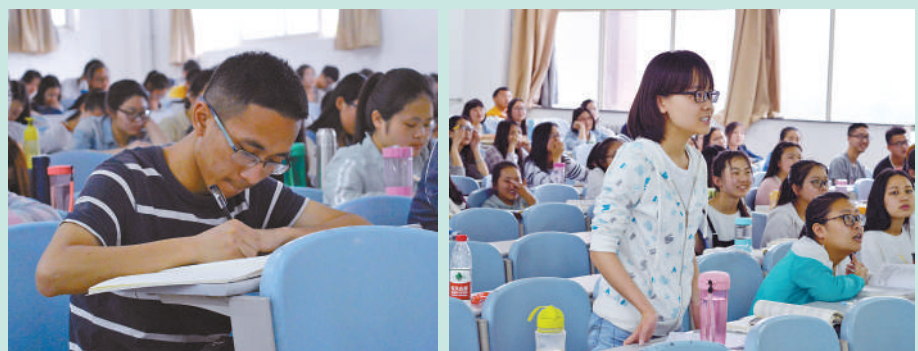
17时15分。本次课程安排讲授认知心理学,心理学课堂上不仅仅有基本的理论知识需要牢记,还有贴近生活、精彩有趣的例子。良好的学习习惯就是成功的一半,同学们奋笔疾书,积极交流。课堂上井然有序,一片盛世之景。