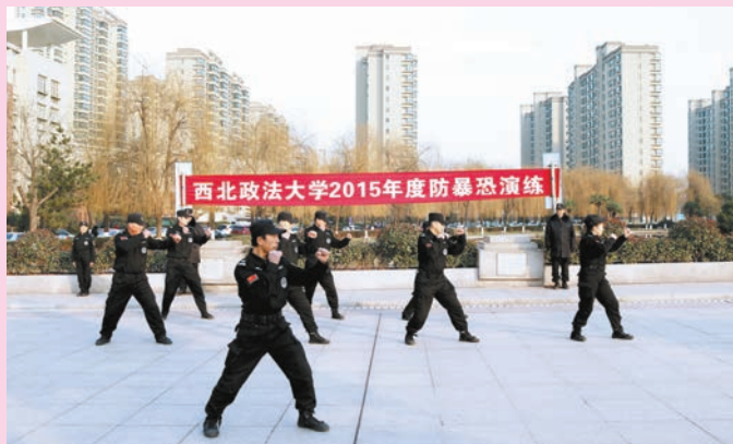
12月17日,保卫处于我校长安校区天平楼广场举行了2015年度反恐演练。此次演练活动分为队列表演、擒敌拳表演及制服反恐分子表演三个部分。