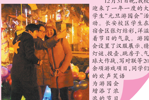
12月31日晚,我校迎来了一年一度的大学生“元旦游园会”活动。长安校区学生在宿舍区张灯结彩,洋溢着节日的气氛。游园会设置了汉服展示、猜灯谜、投篮、跳房子、气球大作战、写对联等20余项游戏项目,同学们的欢声笑语为游园会增添了浓浓的节日氛围。