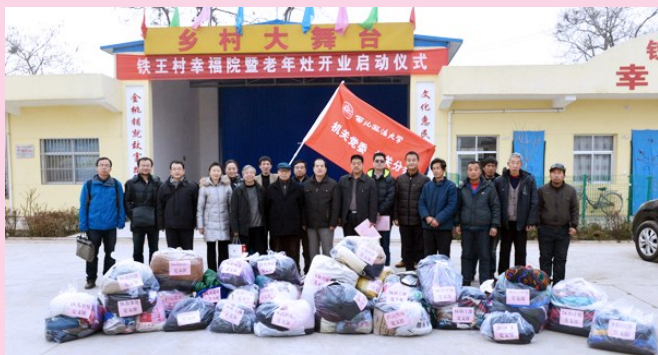
12月24日上午,机关党委党员、教职工捐助的现金、秋冬衣物、中小学学生书籍、文体用品,以及我校关心下一代工作委员会捐助的5台格力电热膜取暖器等,被移送给我校扶贫村铁王村贫困户群众及该村群众子女主要就学的三张镇三张二中。