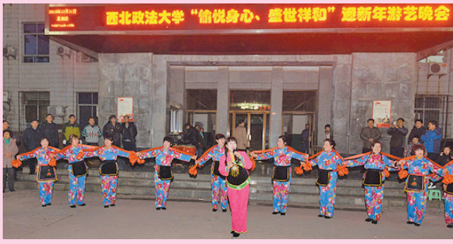
为了迎接2016新年的到来,丰富教职工业余文化生活,“愉悦身心、盛世祥和”元旦游艺晚会于12月31日晚在我校雁塔校区行政楼前广场举行,15个分会和社区为大家准备了丰富的游艺节目。师生、居民们在欢乐、祥和的气氛中度过一个美好的新年之夜。