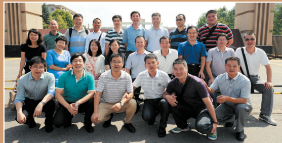
1997级部分研究生校友毕业15年返回母校