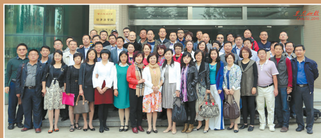
原经济法系1986级校友毕业25年返回母校