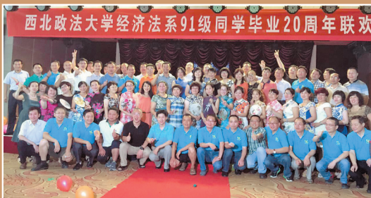
原经济法系1991级校友毕业20年返校联欢