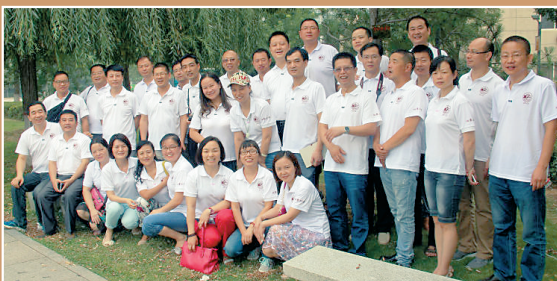
原经济法系1995届7班校友毕业20年返回母校