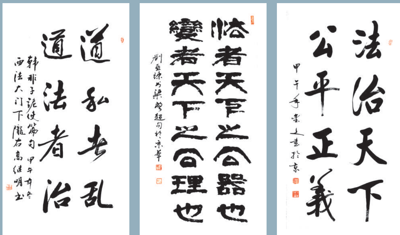
高继明书 刘亚谦书 李铭文书

凹,三山环抱,朝南直面汉江,形成了很多独立的小气候,水量充沛,气候宜人,传说这里的先人们三百多年前从湖南广东一带迁徙到此,一辈一辈的修梯田,梯田是顺着山坡地势,成片修筑,层层错落,片片相连,气势也够宏大。每年农历四月,小满时节,梯田灌水插秧,连片的梯田宛若连片的镜面,水光潋滟,云影徘徊,你一定会陶醉在这里。不仅如此,这里还有美景,阳春三月,油菜花盛开怒放。块块梯田繁花似锦,犹如被彩笔描绘,灿灿连成片,整个山村田野都是浓妆艳抹的油彩世界。于是,影友们视这里为摄影的天堂,西安的众影友不用说,就是北京的影友们也成群结队来赴盛会。