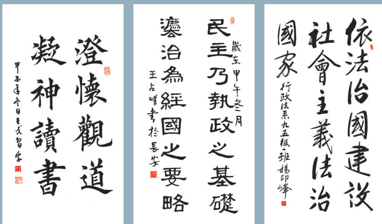
王戈书 王占峰书 杨卯峰书

本报讯 4月10日,我校长安校区行政楼一楼举办了以“尚法治,铸法魂”为主题的书画展,展览由校工会、党委宣传部、校友工作办公室联合主办。此次展览共展出我校师生及校友作品120余幅,涉及书画两类。作品以“法治”为核心,旨在弘扬社会主义核心价值观、依法治国等。现场作品风格多样,或大气磅礴、或舒缓细腻、或笔力雄健,我校师生及校友充分将法治情怀寓于笔墨之中,以书画的形式诠释了法源、法魂、法治、法理的思想理念。本次展出在宣扬社会主义法治国家建设的同时,展示了我校法学院院特色,对我校法学教育理念的培育和校园文化建设具有重要意义。(学通社 王永刚)