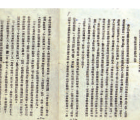
▲1951年西北人民革命大学招生简章

工作,是非常注重实际的。共产党和人民政府的一切措施,都是为了解决人民群众的实际问题,工作人员的服务好坏以工作的实际效果做标准,要向大家讲清楚,今天实际工作中是有很多困难的,特别是新干部,刚走到实际工作中去。情况不熟悉,群众不熟悉,工作不熟悉,周围共事的人也不熟悉,这就必然要碰到许多困难。我们对于这些困难采取什么态度呢?是被困难将自己吓倒,灰心丧气呢?还是勇往直前去战胜困难呢?这就是对我们每个人的考验。我们一定要战胜困难。只要我们在和一块工作的同志很好的团结,特别是向老干部学习,紧密联系群众,刻苦用功,不断改正缺点,求得进步,任何困难,都是可以克服的。而且只有在不断克服困难中,才能真正锻炼自己的革命思想,把自己锻炼的坚强起来,所以为人民服务,不仅是一般的口号,而是要表现在每个人的具体活动中。这就