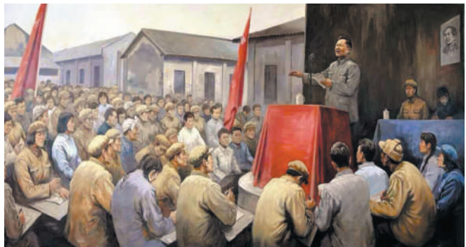
▲习仲勋在毕业典礼上的讲话

一方面,既已入学,就要改造思想,建立新的、革命的人生观、世界观,学习马列主义与毛泽东思想。为人民服务。