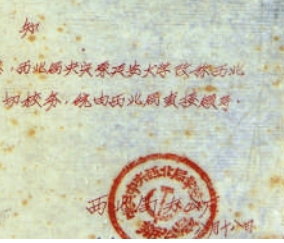
▲1953年3月,中共中央西北局文件:将西北人民革命大学改称西北政法干部学校

为社会的进步,应当把经验总结起来,写成文章介绍各地,有利于推动各地的学习运动。民大第一期的全体同学们,已经在学习中,经过思想改造,初步建立了为人民服务的思想,就要走上各种实际工作岗位。我代表人民政府表示热烈欢迎。参加实际工作,为祖国和人民贡献自己的力量,是大家共同愿望,也是对大家的一种新的考验。我们做革命