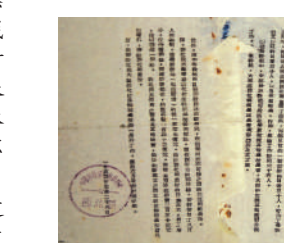
▲1953年西北人民革命大学招生简章

为社会的进步,应当把经验总结起来,写成文章介绍各地,有利于推动各地的学习运动。民大第一期的全体同学们,已经在学习中,经过思想改造,初步建立了为人民服务的思想,就要走上各种实际工作岗位。我代表人民政府表示热烈欢迎。参加实际工作,为祖国和人民贡献自己的力量,是大家共同愿望,也是对大家的一种新的考验。我们做革命