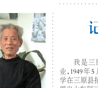
我在这辈子很幸福,在学校学到了不少知识。我心满意足,还要啥东西?