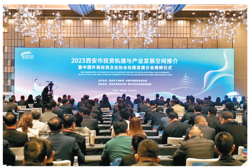
2023西安市投资机遇与产业发展空间推介暨中国外商投资企业协会丝路发展分会揭牌仪式现场